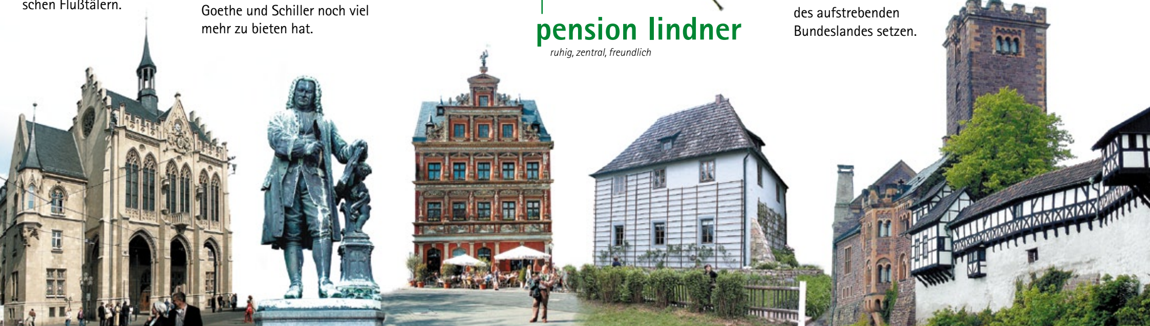
Erfurt - Landeshauptstadt mit historischem Charme, sehenswerter Altstadt und freundlichen Menschen

Und natürlich ist Thüringen auch das Land der Investoren, die auf die wirtschaftliche Zukunft des aufstrebenden Bundeslandes setzen.