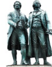
Dichter und Denker

... in Erfurt-Künnhausen übernachten Sie ruhig und zentral. Herzlich Willkommen.